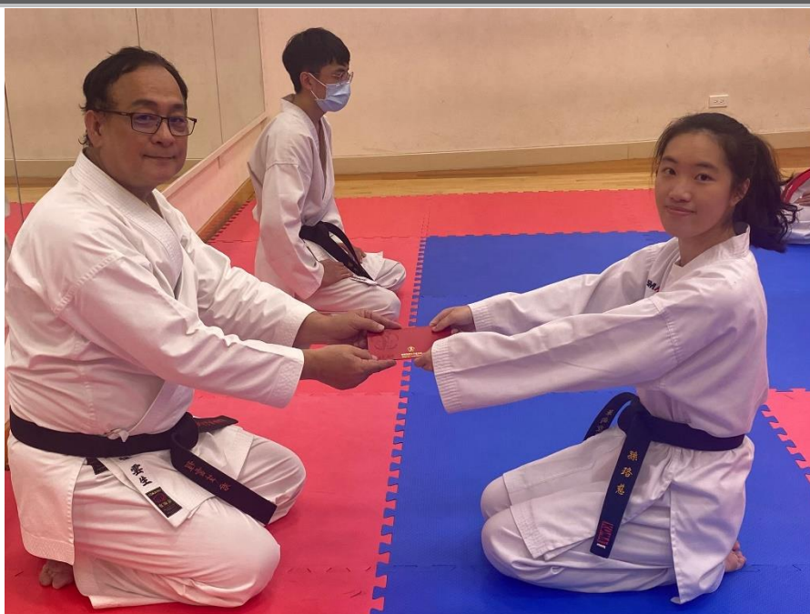
拍攝時間：110/10/20 拍攝內容：頒發上個學期比賽獎金。