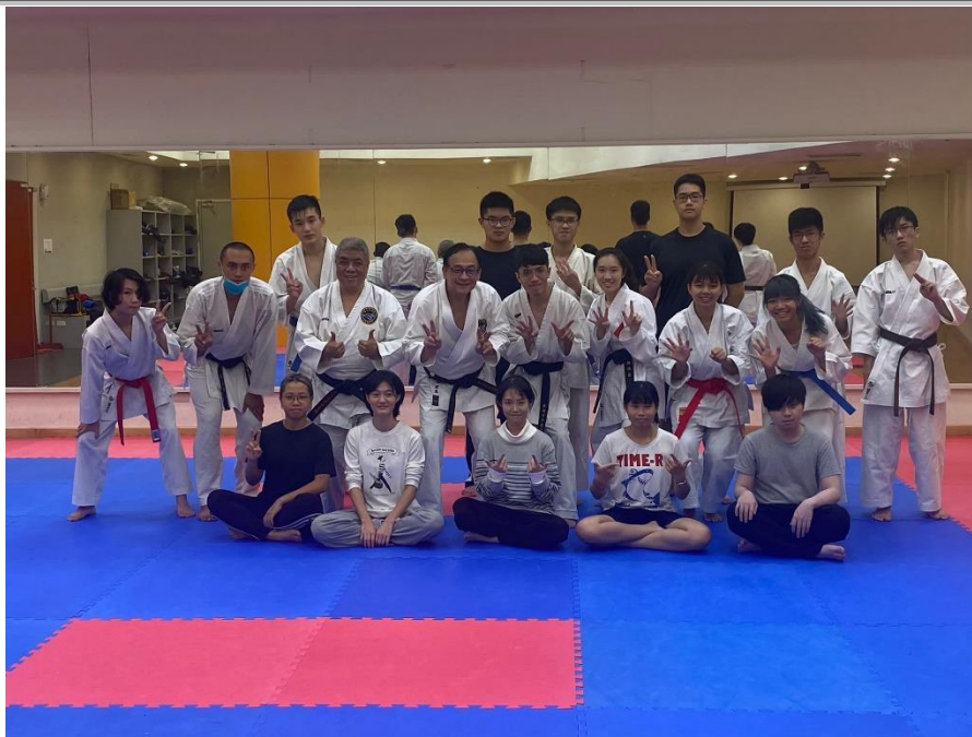
拍攝時間：110/10/20 拍攝內容：第一次社課後的合照