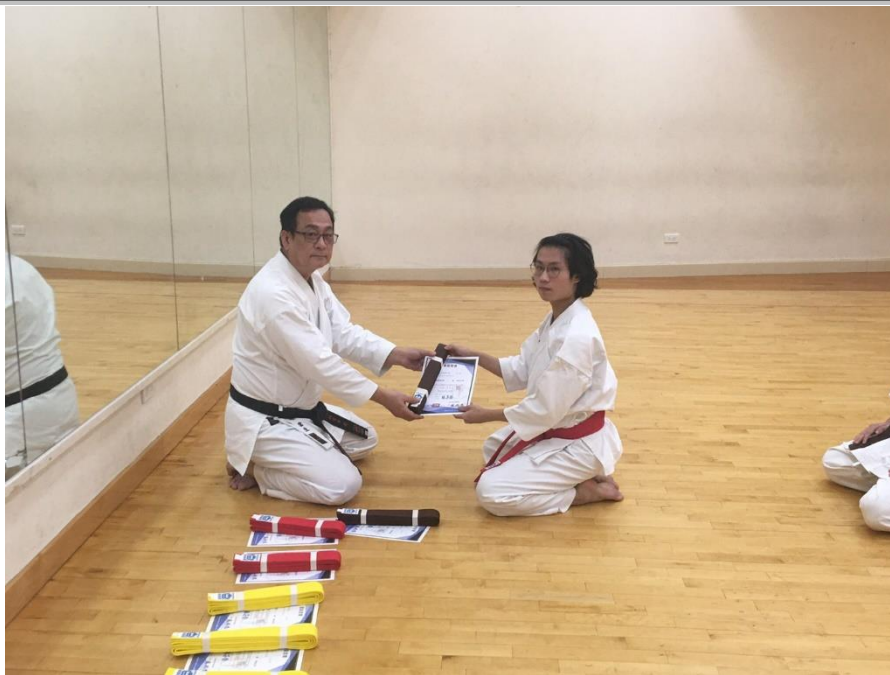
拍攝時間：110/11/22 拍攝內容：空手道升級證書及道帶頒發