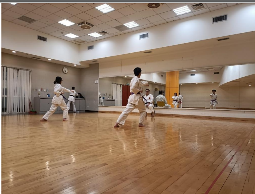
拍攝時間：110/11/13 拍攝內容：八、四、三、一級社帶檢定-基本動作檢定